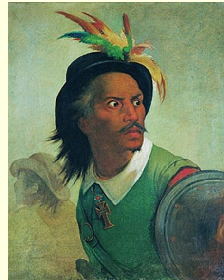
Imagem: Victor Meirelles, retrato de Felipe Camarão, 1874-1878, Museu Victor Meirelles

Negro liberto, o mestre-de-campo Henrique Dias participou dos 24 anos de guerra contra a invasão holandesa, sendo ferido oito vezes em combate.