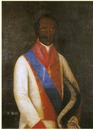
Imagem: Autor desconhecido, retrato de Henrique Dias, século 17, Museu do Estado de Pernambuco, disponibilizado por Dornicke / United States Public Domain

Senhor de engenho, André Vidal de Negreiros, um dos líderes da expulsão dos holandeses de Pernambuco