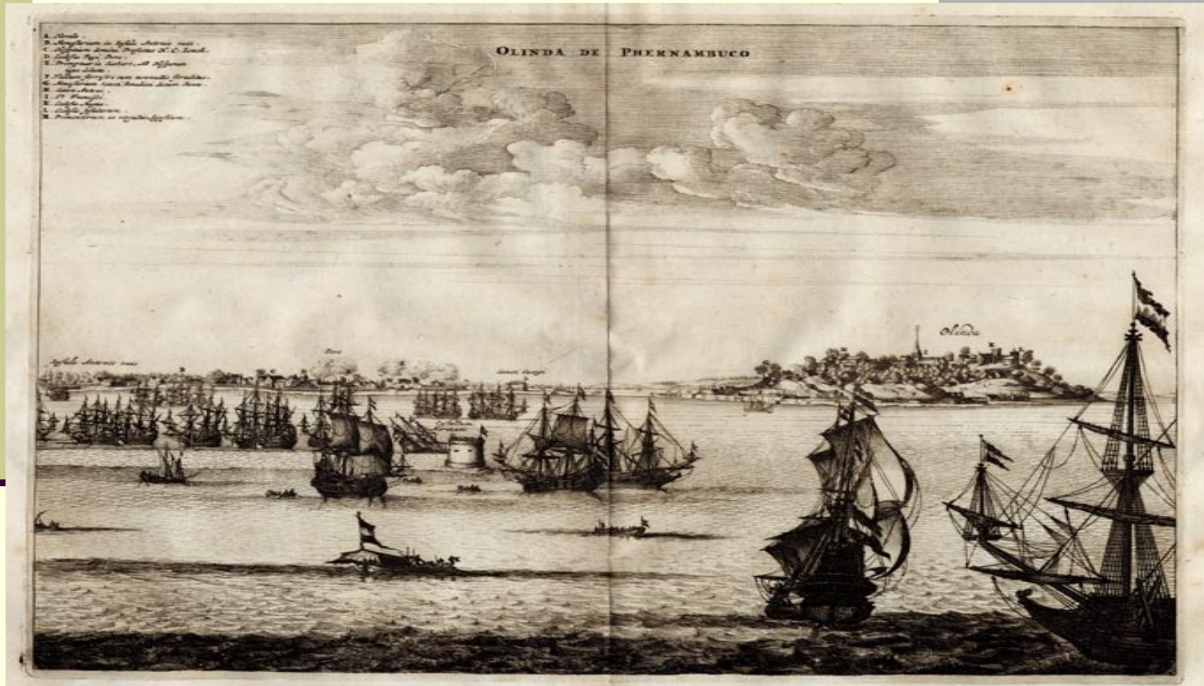
Imagem: John Ogilby / Dutch Siege of Olinda / Public Domain