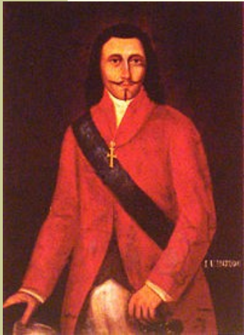
Imagem: Autor desconhecido, retrato de André Vidal de Negreiros, século 17, Museu do Estado de Pernambuco, disponibilizado por Dornicke / United States Public Domain

Senhor de engenho, André Vidal de Negreiros, um dos líderes da expulsão dos holandeses de Pernambuco