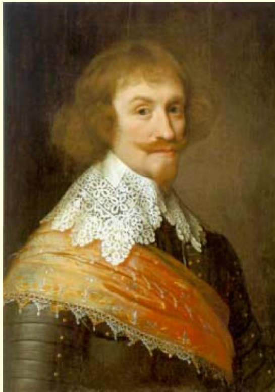
João Maurício de Nassau Siegen